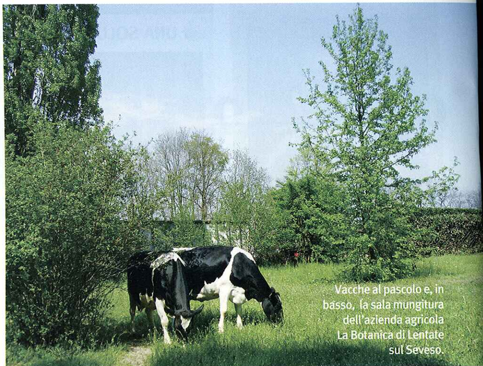
Vacche al pascolo e, in basso, la sala mungitura dell'azienda agricola La Botanica di Lentate sul Seveso.